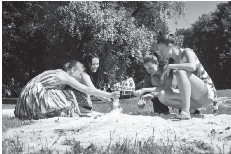
Juunikuus lumememme ehitamas.

Innar Rohtsalu, Imavere kooli majandusjuht: „Suure paduvihma ja rahe ajal alla voolanud vesi lõhkus ära vihmaveetoru, mis läheb üle kanalisatsiooniks. Purunenud torust voolas vesi koolimaja keldrikorrusel kõikidesse ruumidesse peale töökoja. Suure pahinaga katusele langenud