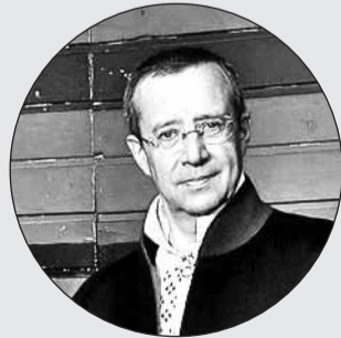
TOOMAS HENDRIK ILVES Eesti Vabariigi President 2014. aasta Linnade ja Valdade Päevadel

Mistõttu ma kutsungi kõiki omavalitsusjuhte aktiivselt ja nõudlikult osalema riigi ja kohaliku võimu ülesannete tänapäevase jaotuse kokkuleppimisel. Kutsun üles vabakonda, küla- ja asumiseltse välja käima ideesid, milline võiks olla nende roll tulevases tööjaotuses. Saagu sellest plaanist eeloleval sügisel algava parlamendivalimiste debati keskne osa.“